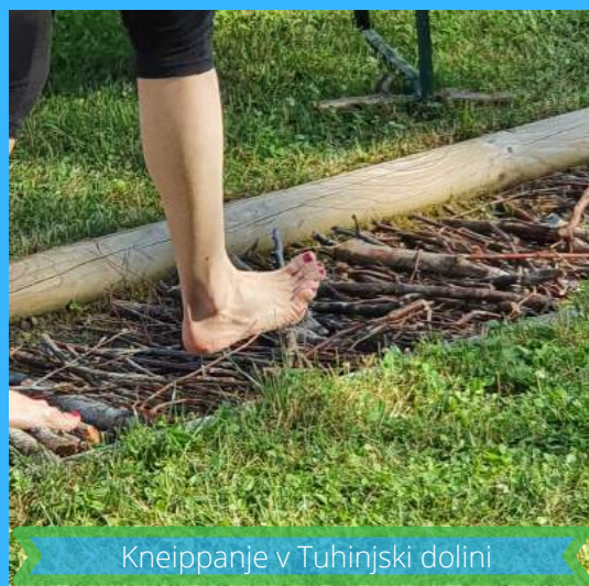
Kneippanje v Tuhinjski dolini