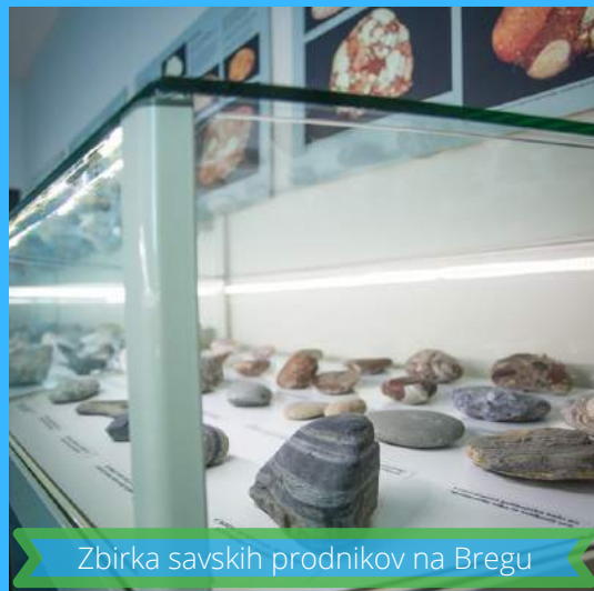
Zbirka savskih prodnikov na Bregu